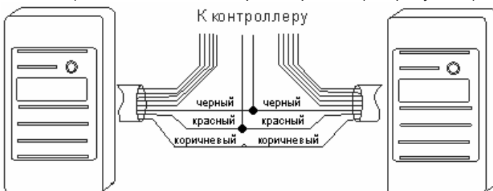
Рисунок 3 – Подключение синхронизированных считывателей

При размещении считывателей в непосредственной близости друг от друга (менее 1 м) их необходимо синхронизировать (см. рисунок 3).