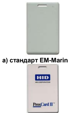
а) стандарт EM-Marlin