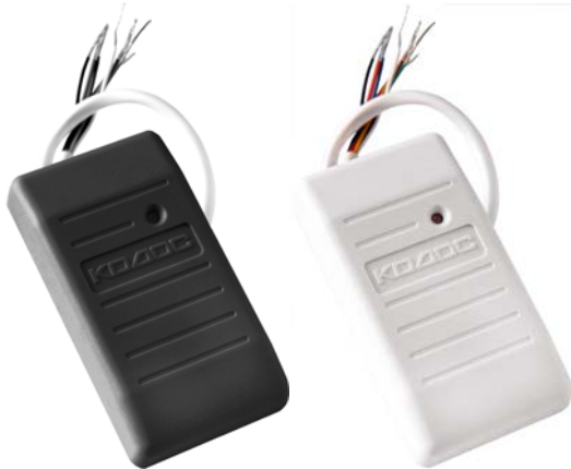
Рисунок 1 – внешний вид считывателя

Считыватель предназначен для приема, обработки и передачи кода бесконтактных электронных кодоносителей стандартов EM-Marlin и HID в линию связи с управляющими устройствами серии «КОДОС» (например, контроллерами «КОДОС ЕС-202», «КОДОС RC-102», ППКОП «КОДОС А-20», и др.) и управляющими устройствами, работающими по протоколу «WIEGAND-26».