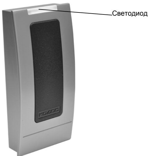
Рисунок 1 – Внешний вид считывателя

Считыватель предназначен для приема, обработки и передачи кода бесконтактных электронных кодоносителей стандарта Mifare в линию связи с управляющими устройствами серии «КОДОС» (например, контроллерами «КОДОС ЕС-202», «КОДОС RC-102», ППКОП «КОДОС А-20», и др.) и управляющими устройствами, работающими по протоколу «WIEGAND-26».